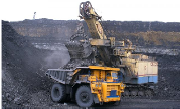
Las tendencias de riesgo están entre el nivel bajo y medio, sobre todo en sectores como minería, construcción y energía.

Las tendencias de riesgo en América Latina y en México están entre el nivel bajo y medio, sobre todo en sectores como minería, construcción y energía.