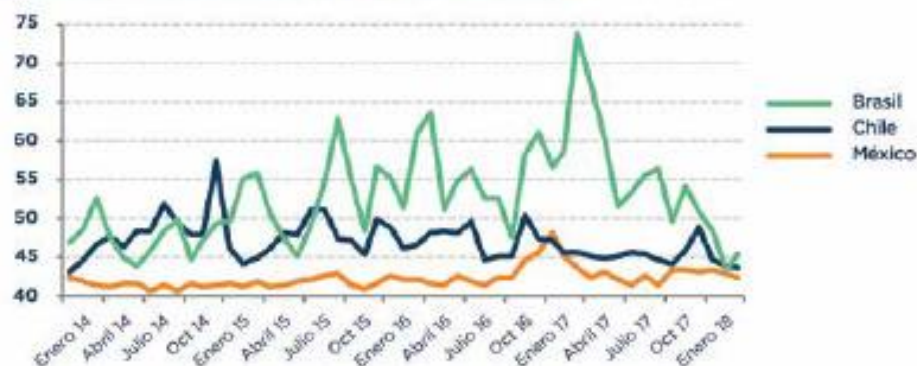
GRÁFICA 3 Índice de Incertidumbre de Política Económica

Desde entonces, el índice de México ha decrecido, aun con el actual contexto, en el que la llegada de AMLO a la silla presidencial es inminente.