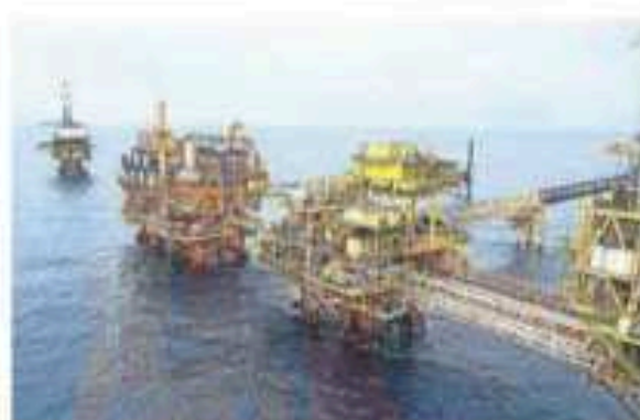
De concretarse la compra del petróleo de EU, se registraría un hito histórico porque es la primera vez que se importará crudo para el consumo interno.

rriles diarios, un millón 88 mil barriles corresponden a crudo pesado.