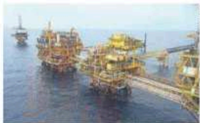
Con el relevo en la dirección de Pemex, parte de los programas de inversión quedaron en espera, e incluso se cancelaron dos contratos.

PROYECTOS fueron lo tanto para Grupo R, de Ricardo Garza Cuatrecasas, beneficiado de contratos por 8 mil 434 millones de pesos.