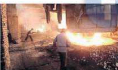
El sector acerero está en una crisis profunda a escala global, y las aseguradoras consideran de riesgos los créditos entre empresas del ramo.

El consumo del material cayó 3.3% en 2014 y se contrajo 7% el año pasado, informó la empresa japonesa. Sin embargo, en 2016 los riesgos crediticios entre empresas metalúrgicas están en la categoría de "muy alto riesgo" en los países emergentes de Asia, en Latinoamérica, medio oriente y Europa del este y en "alto riesgo" en Europa central y Norte